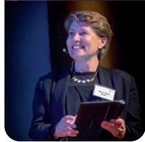
Présidente du Cercle InterElles

« Depuis 20 ans le Cercle InterElles s'est engagé en faveur de la mixité et de l'égalité professionnelle dans les secteurs scientifiques et technologiques, avec l'ambition de créer les conditions favorables à l'équilibre des genres et à la performance.